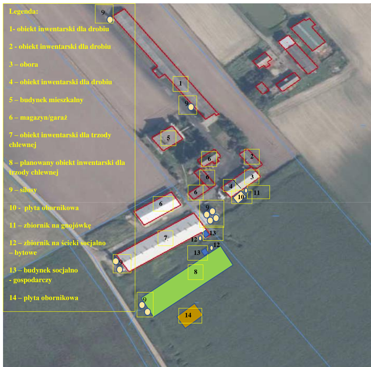
Rysunek 4. Rozmieszczenie obiektów budowlanych w stanie planowanym gospodarstwa.