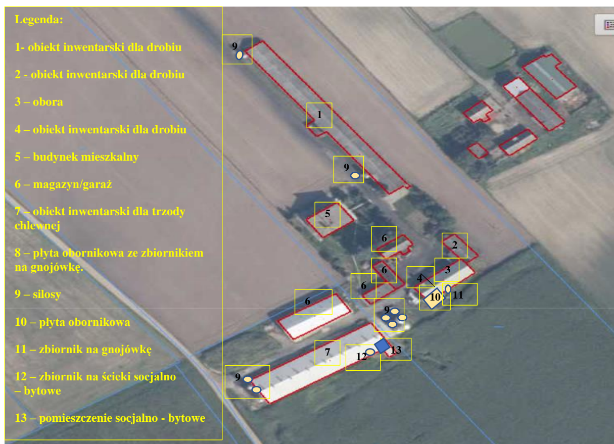
Rysunek 3. Rozmieszczenie obiektów budowlanych w stanie istniejącym gospodarstwa.

„Budowa budynku inwentarskiego – chlewni wraz z infrastrukturą towarzyszącą oraz zwiększenie obsady w chlewni istniejącej w miejscowości Linne, gmina Rypin.”