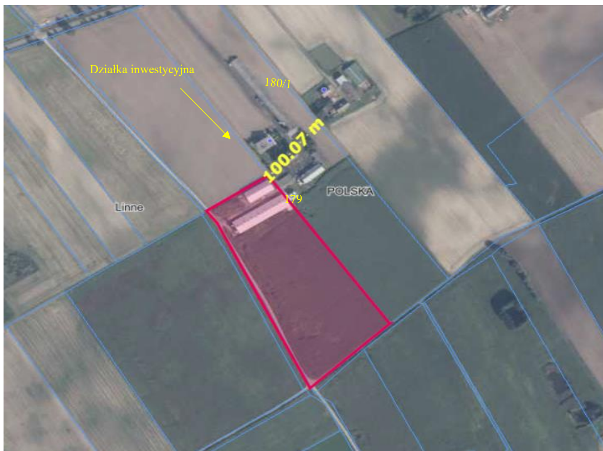
Rysunek 2. Lokalizacja działki o nr ewid. 179, obręb Linne oraz odległość granic terenu inwestycyjnego względem najbliższej położonej zabudowy zagrodowej. (źródło: opracowanie własne na podstawie www.geoportal.gov.pl ).

Granica najbliższej zlokalizowanej zabudowy zagrodowej, licząc od granicy działki inwestycyjnej o nr ewid. 179, nie będąca własnością Inwestora, znajduje się w odległości: